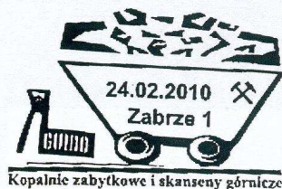
Kopalnie zabytkowe i skanseny górnicze

Z OSTATNIEJ CHWILI: od 05.03.2010 w UP WARSZAWA 4 (03-700) jest stosowany datownik o treści: „Międzynarodowe Targi Znaczków w Monachium 5-7.03.2010”. Na grafice pociąg. Ilustracja na str. internetowej Klubu.