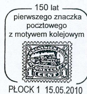
PŁOCK 1 15.05.2010