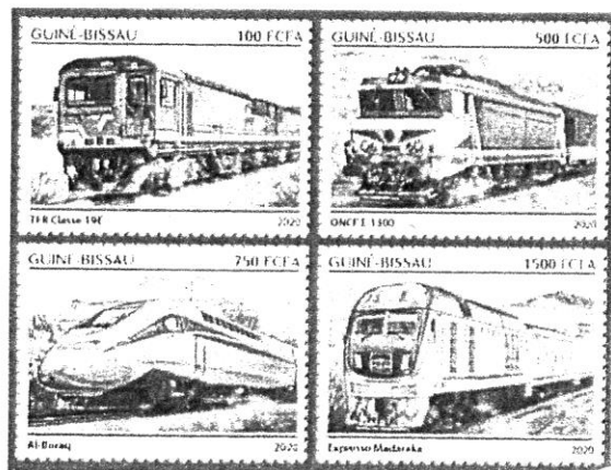
Guinea - Bissau - 2020