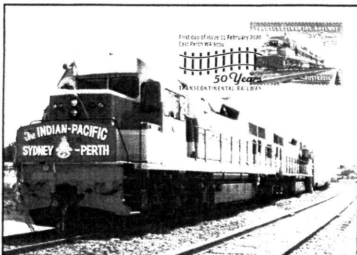
50 Jahre „The INDIAN-PACIFIC - SYDNEY-PERTH”

„HANMART”, ul. Jana Pawła II 1, 89-632 Brusy tel. 606-420-343 hanmart@hanmart.pl